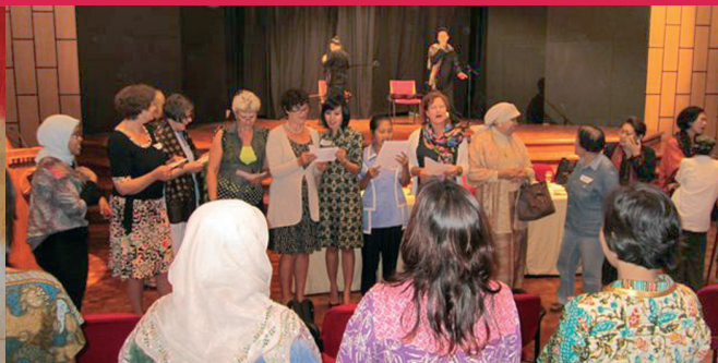
Zingen op de Kartini dag in Indonesië.